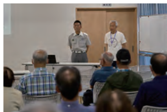
多くの方に聴講頂きました