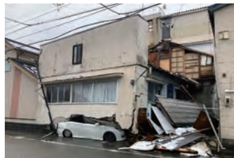
押しつぶされた自家用車