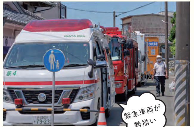
緊急車両が勢揃い