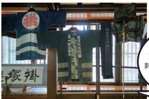
昔の消防団の方が着ていた刺し子の絆纏・頭巾などを展示