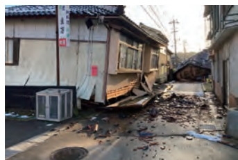
行く手を阻む倒壊家屋