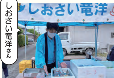
じょうろで電洋さん