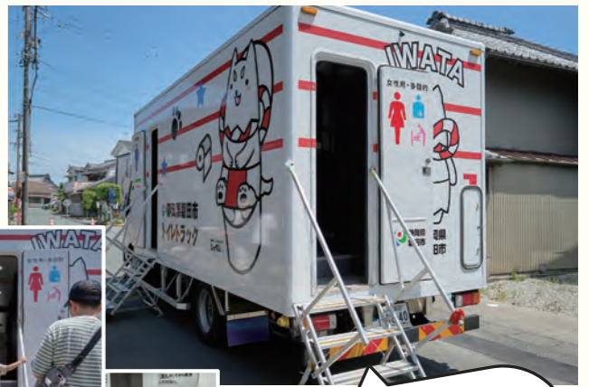
実際に能登で活躍したトイレトラックが来てくれました!