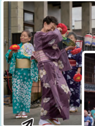
掛塚屋台音頭や、花笠音頭など、楽しくみんなで踊ってくれました。