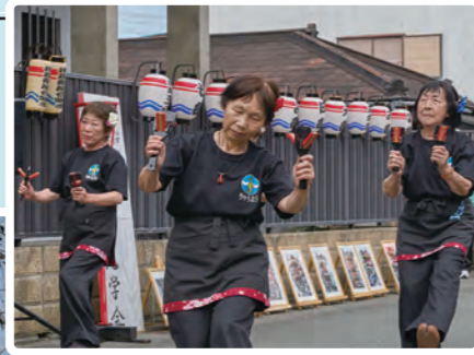
商工会女性部のよさこいチーム