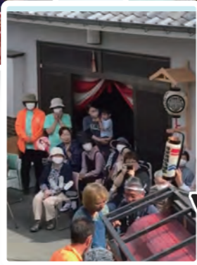
尺八と三味線の演奏を披露してくれました。