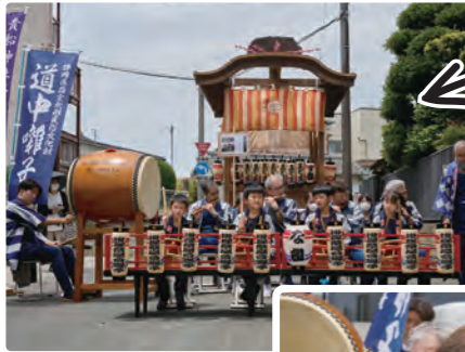
中町のお囃子の披露