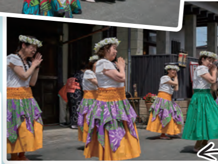
フラダンス同好会の皆さん