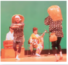
普段とのギャップが(笑)これは生で見なくては!!

私たちが恒例の無茶振りで「梅は咲いたか桜はまだか」を弾いてもらいました。目を瞑って聞いていると時代劇のお座敷遊びのシーンが目に見えました。(笑)日本の楽器の音色は風流でいいですね。