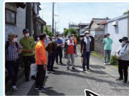
町歩きに沢山の方が参加してくれました。