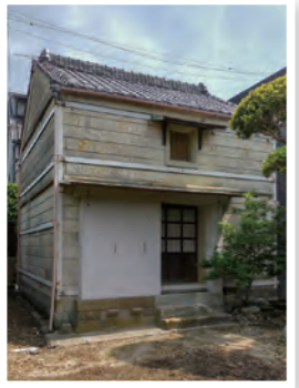
伊豆石で作られた土蔵

「旧津倉家住宅」が、国の登録有形文化財になることが決まりました。三月十七日の国の文化審議会で、旧津倉家住宅の「主屋」・「応接棟」・「土蔵」の三棟を登録するよう答申が出され、掛塚地区での登録有形文化財は三件六棟となります。 「文化財」とは、「人類の文化的活動によって生み出された有形・無形の文化的所産」と定義され、あらゆるものが含まれますが、その中で貴重なものが指定、選定、登録されて将来的に保存されるよう、法律(文化財保護法)によって定められています。文化財には、有形文化財、無形文化財、記念物、民俗文化財、埋蔵文化財などいろいろ分野があり、また有形文化財には絵画や工芸品、建造物などがあります。 文化財に対する考え方は、時代によって変わってきていて、三〇年くらい前から「保存から活用へ」といわれるようになりまし。大事なもののだから押入れの奥にしっかり保管しておくというのではなく、多くの人が文化財に触れて時代や文化を体験することができるようにしようという考えです。特に建造物は、古い建物を事務所や商店、旅館などに活用すれば、多くの人が身近に接することができます。このため、登録文化財は、外観は保存を義務付けられますが、内部は、居住空間や店舗等として改造することが可能なのです。 また、五年前に改正された「文化財保護法」では、更に「活用」が重視され、文化財を観光資源として積極的に活用し、経済的な裏付けによる保存効果を期待するようになってい