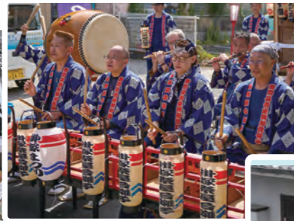
掛塚屋台囃子保存会の方々もお囃子を披露して盛り上げてくれました。