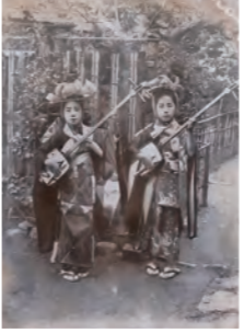
このどちらかが9歳のお母様(笑)