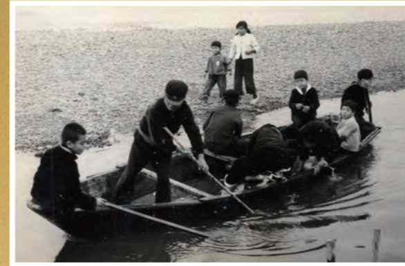
● 天竜川で船で遊ぶ子どもたち - 昭和33.3 - (芥田さん提供)