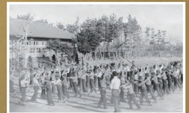
● 掛塚小学校の校庭