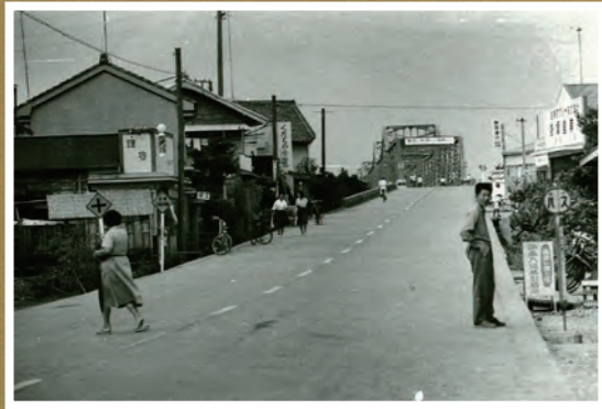
● 国道150号掛塚付近