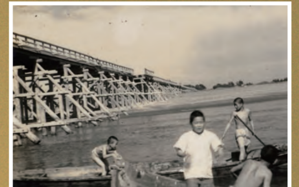
● 天竜川で船遊び - 昭和28~29年頃 - (霧谷さん提供)