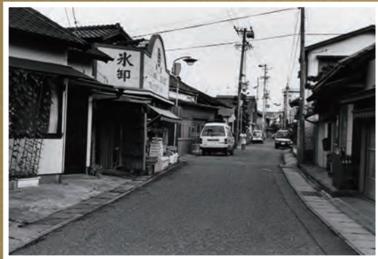
● ももや前