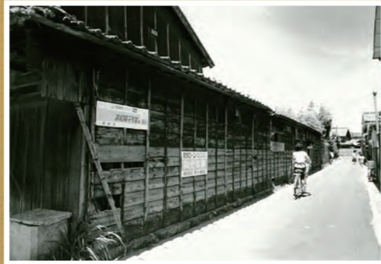
● 路地 - (原さん提供)