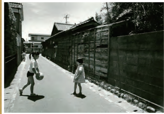
● 横町付近 - 昭和30年頃 - (原さん提供)