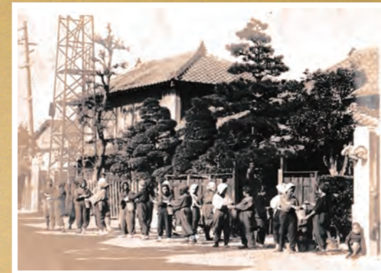
● 戦時中バケツリレー