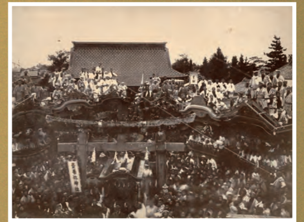
● 貴船神社祭典各町屋台集合写真