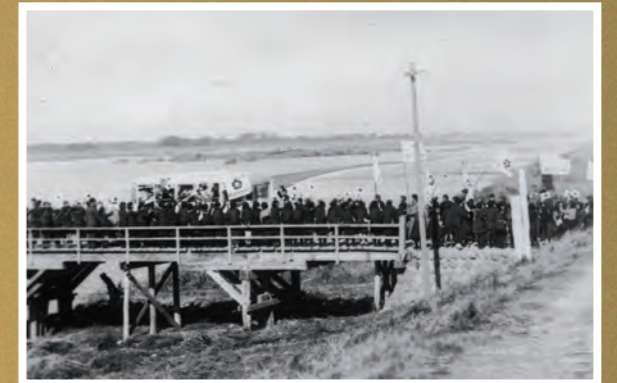
● 旧掛塚橋の東の端