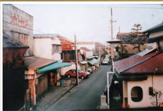
● 掛塚郵便局2階から撮影